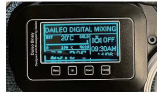
専用コントローラ ※画像は開発中のものです